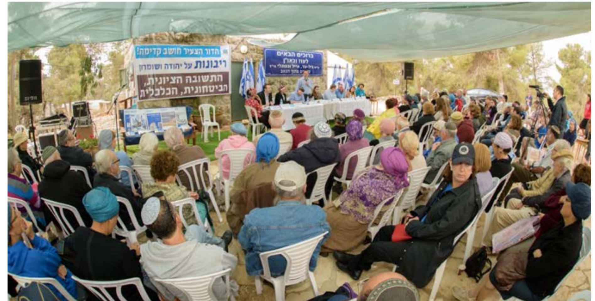
מאת הגיעו לפאנל הריבונות בעוז וגאון