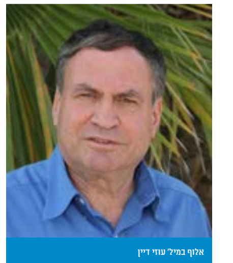
אלוף במיל' עוזי דיין

בכל סיור מגלה דיין כעשרה עד עשרים אחוזים של פנים חדשות. האוכלוסייה, הוא מספר, מגיעה מכל רחבי הארץ, חלקם בקבוצות וחלקם בבודדים. כשהוא מגיע עם