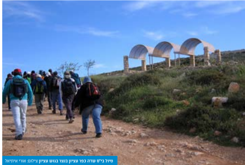
טיול ב"ש שדה כפר עציון בנצר בנוש עציון