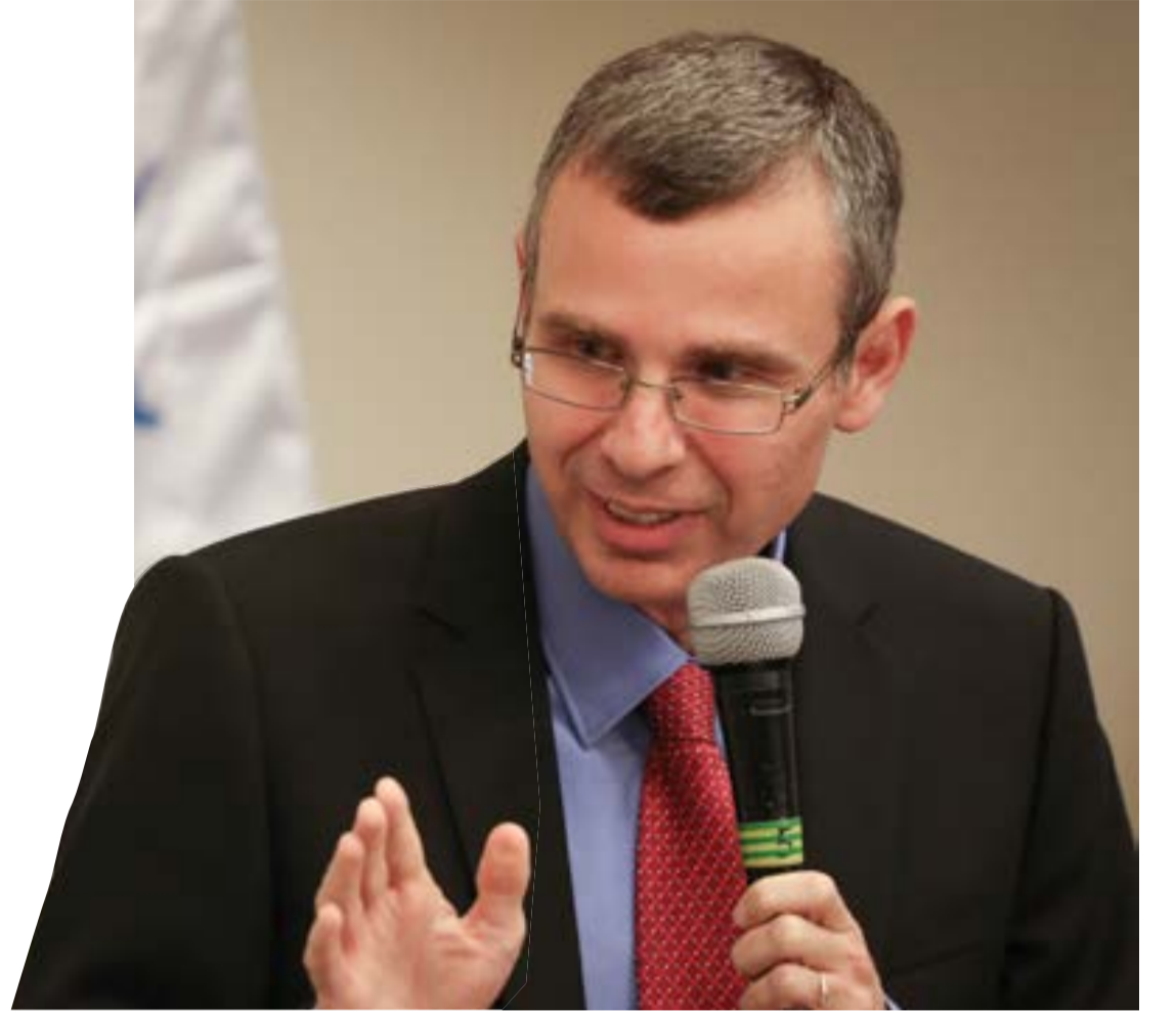
שר התיירות יריב לוין

חבר הכנסת מיקי זוהר משוכנע שאם כל חטאת מדינית וריבונית הם הסכמי אוסלו שעדיין מסנדלים את הפוליטיקאים שלנו ואפילו את בג"ץ.