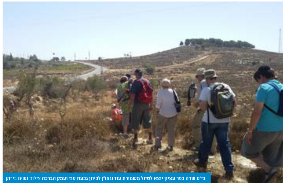
ב"ש שדה כפר עציון יוצא לטיול משמורת עוז וגאון לכיוון גבעת עוז ועמק הברכה

באילת יש צבא עשומר על המתרחצים בחוף וכך גם בראש הנקרה יש בסיס צבאי כי זה אתר תיירות. כך גם כאן. כשיש כאן מקום של נופש וטיולים צריך לאבטח. אין סיבה שהדם של מי שרוצה לטייל ב"ש יהיה פחות סמוך