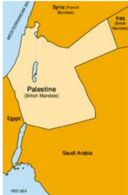
ארץ ישראל המערבית והמזרחית יותנה לבריטניה כפיסקודן להקמת בית לאומי לעם ישראל. מפה של גבולות המנדט הבריטי.

במקום לטעון שאנחנו מממשים את זכויותינו על הארץ אנחנו מדברים על ביטחון. הפלשתינים מדברים על צדק ואנחנו על טרור וכשממשיכים לדבר רק על הגנה עצמית העולם הוא שתחזיר את השטח שלהם ויהיה לך שקט.