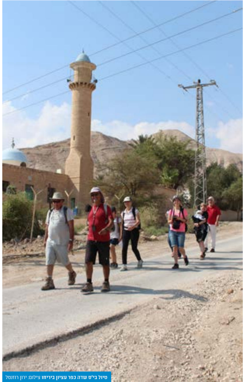
טיול ב"ש שדה כפר עציון בירחו