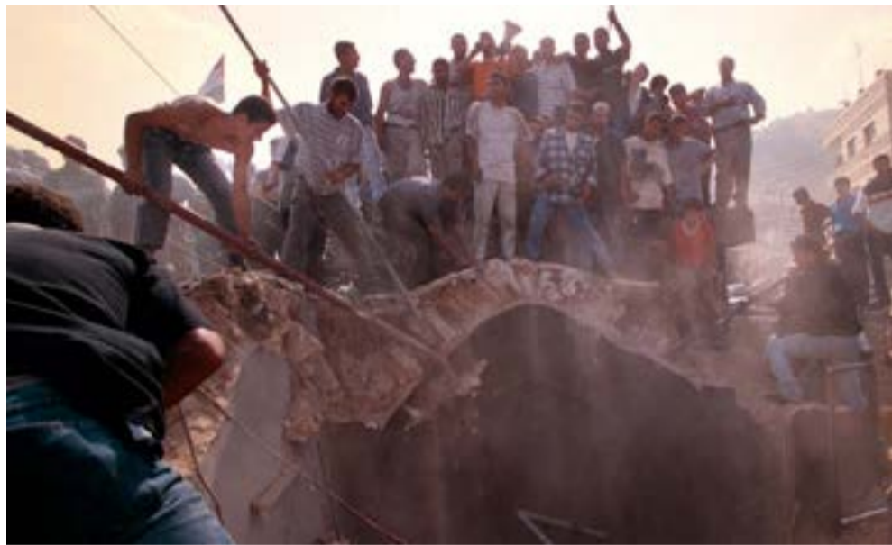
'מתחם קבר יוסף בשליטה ישראלית הרי זה הודות לאדם אחד, קצין אחד... עוזי דיין אלוף הפיקוד' (מעיתונאי חוגי הנוכח). מתקפה נרביית על קבר יוסף אוקטובר, 2000.

לברך בכל יום 'הגומל' על כך שלא התפתינו לרעיון 'הגאונ' של ויתור על הגולן בתיווכו 'ההוגן' של ארדואן. בדרום יש לנו גבול סביר משום שסיני הוא אזור מפורז, ובמזרח יש לנו את בקעת הירדן. אנחנו צריכים עומק אסטרטגי ועם כל ההשתכללות הטכנולוגית והרקטית הקרקע אינה מאבדת מהשיבותה. המחוקק בין בקעת הירדן לים התיכון הוא 40 מייל. זה ללא ספק המינימום שבמינימום לשמירת הביטחון. הסיבה השנייה היא החובה שלנו להגן על החזית המזרחית. במשך שנים אמרו לנו שאין חזית מזרחית אבל היום ברור לכול ששום דבר לא ברור לגבי הצפוי להתרחש בירדן ובעיראק'. 'מעבר לכך', מוסיף דיין, 'אין אפשרות להיאבק בסרור מבלי שתהיה שליטה על המעטפת והבקעה נותנת את השליטה הו שתאפשר לנו מאבק אפקטיבי בסרור'. גם בדבריו אלה הממוקדים באספקטים הביטחוניים הוא מקפיד להדגיש את החשיבות הלאומית והאמונית של גבולות הארץ כבסיס המשמעותי והחשוב יותר לחובת האחיזה בבקעת הירדן. דיין מדגיש את חובת יישובה של הבקעה כערך לאומי מוביל. באזור זה, הוא מציין, חיים כיום רק חמשת אלפים מתיישבים, 'יש שם כעת פחות משני שלישי מגוש קטיף. לכן, כיום, בעשור לאסון הלאומי הזה שהבאנו על עצמנו, אסון ההתנתקות מגוש קטיף, צריך לדאוג שבבקעת הירדן יהיו פי עשרה אנשים, ושהאזור