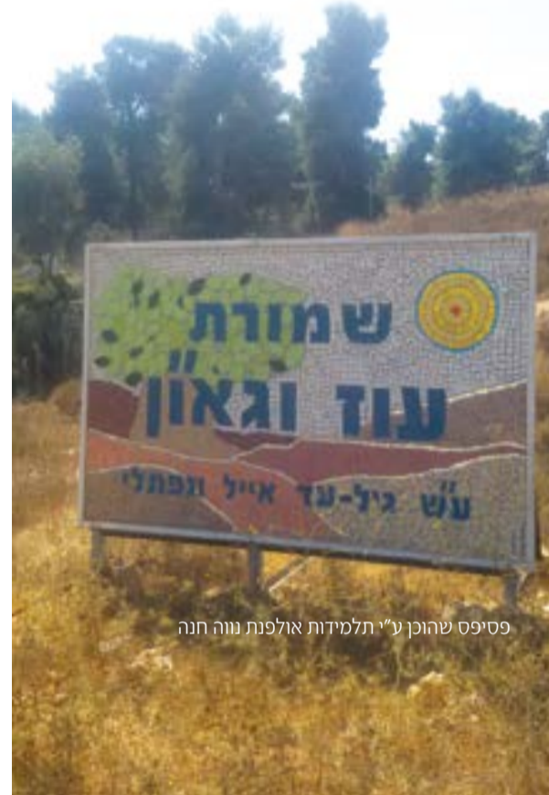
פסיפס שהוכן ע"י תלמידות אולפנת נווה חנה