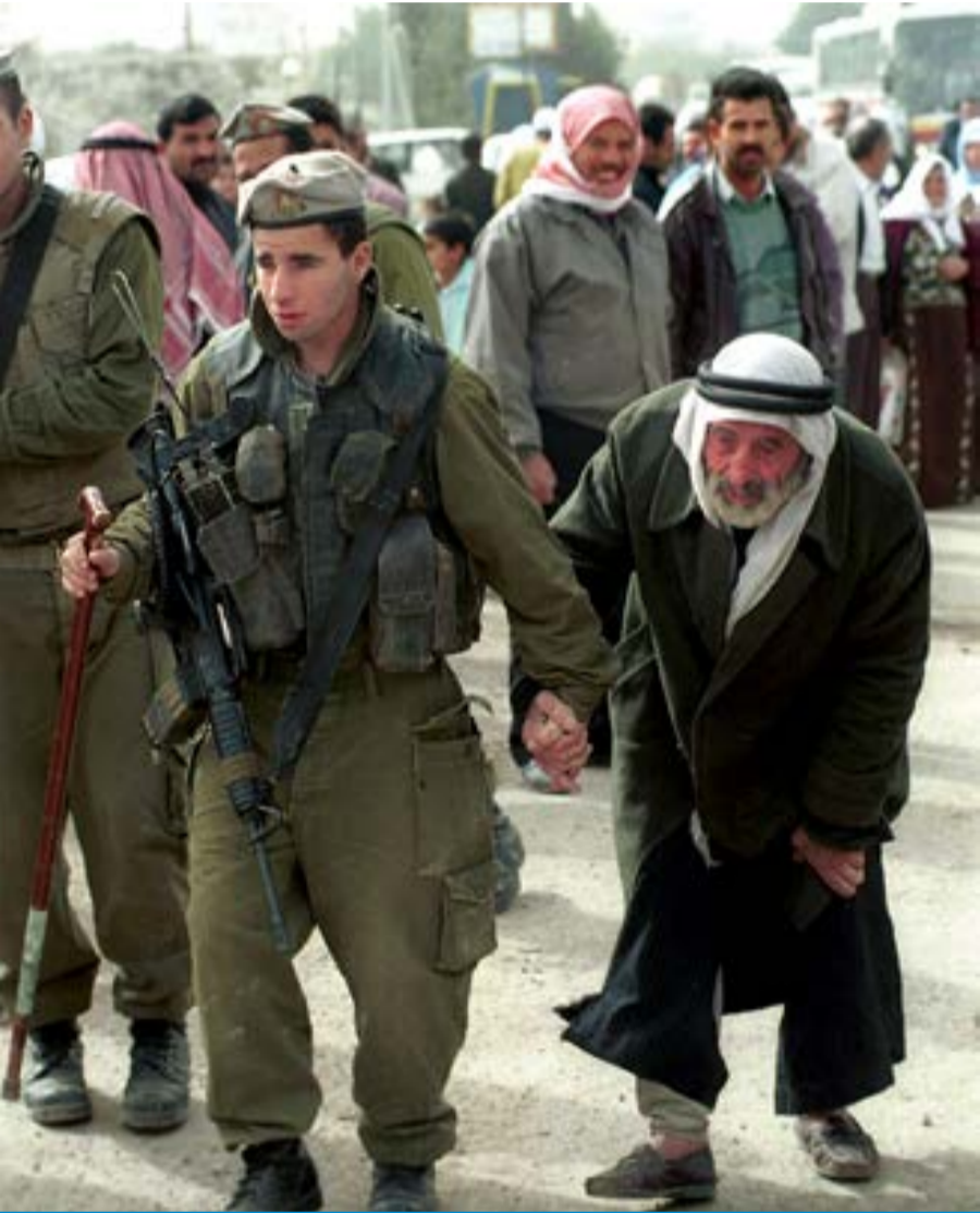
הצבא הכי מוסרי בעולם - חייל צה"ל מסייע לזקן ערבי במחסום בית לחם. התמונה צולמה במהלך האינטיפאדה הראשונה אף שהלוחמים שהוצבו שם ספנו אבנים ומהומת מדי יום יליום

הערבים הם אויבנו; אנו נאבקים עמם על ארץ ישראל. את המלחמה הזו יש לנהל בעוצמה, בגבורה, בתקיפות, בנחישות,בביטחון מלא בצדקתנו, במסירות נפש ובאמונה שלמה. לא מתוך זלזול באויב (ככל המובנים) ולא מתוך שנאה.