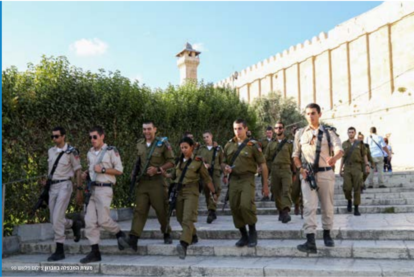
מערת המכפלה בחברון