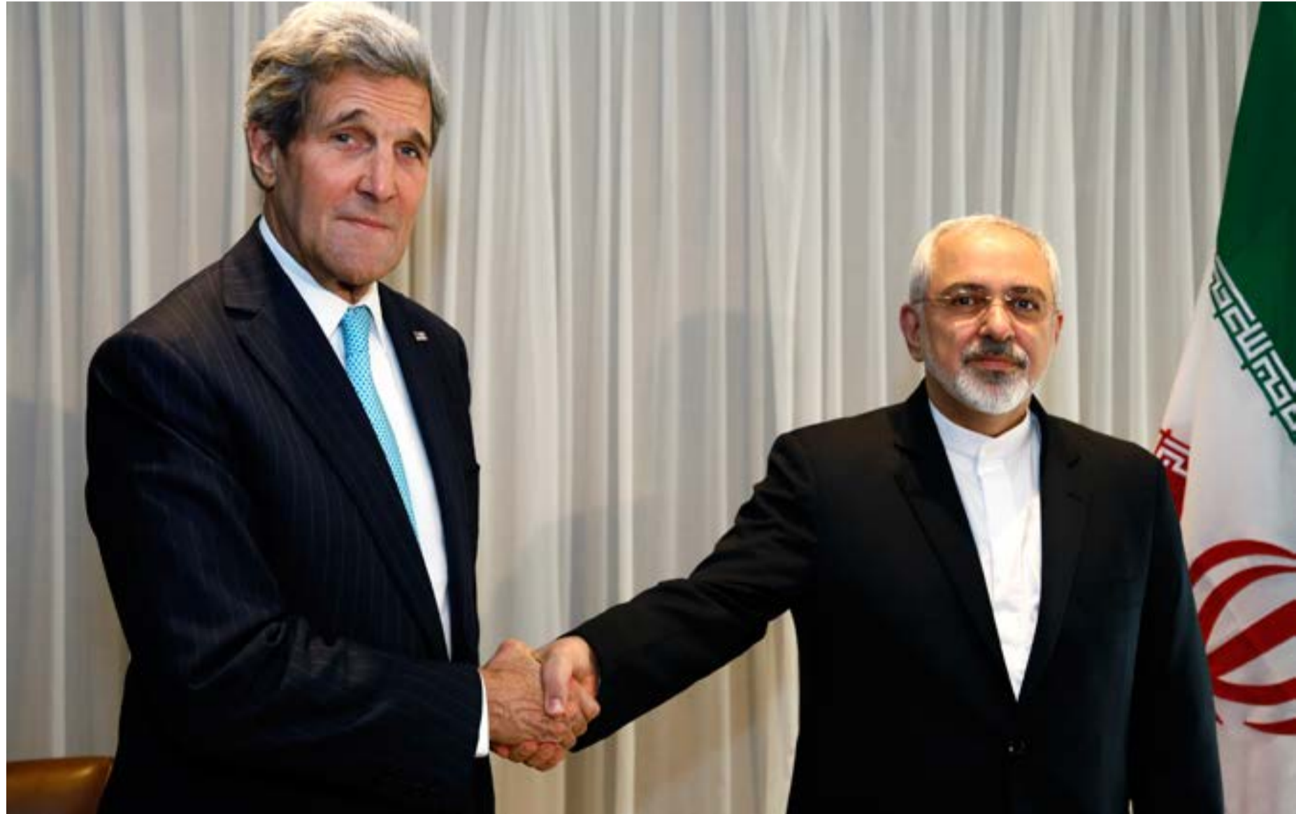
שר החוץ האמריקאי ג'ון קרי לוחץ את ידו של שר החוץ האיראני מוחמד זריף בגיבה ניואר 2015