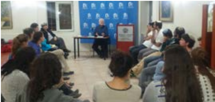
צעירי אר"ץ בפעילות בשוק מחנה יהודה וזא בסמירון עיני אודות הריבונות תשע"ו