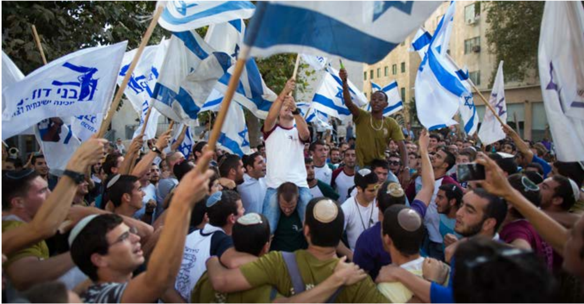
מחזקים את ירושלים, כיכר ציון אוקטובר 2015